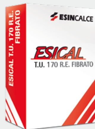
Sacco in carta

T.U. 170 R.E. FIBRATO è un premiscelato per la realizzazione di sottofondi ad asciugatura semirapida composto da inerti calcarei in curva granulometrica controllata, cemento, particolari additivi di nuova generazione e fibre che lo rendono particolarmente lavorabile.