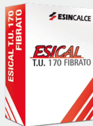
Sacco in carta

T.U. 170 FIBRATO è un premiscelato per la realizzazione di sottofondi a normale asciugatura composto da inerti calcarei in curva granulometrica controllata, cemento, particolari additivi di nuova generazione e fibre che lo rendono particolarmente lavorabile.