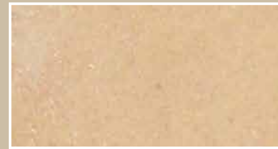
CODICE PFVIVASALMCH12 COLORE SALMONE CHIARO