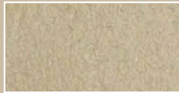
CODICE PFVIVAMATSCURS6 COLORE MATTONE SCURO