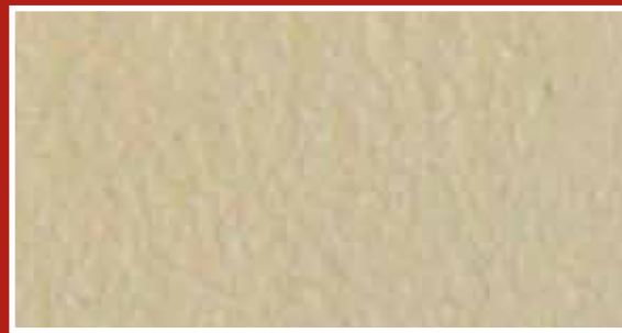
CODICE PFVIVAMATTCH6 COLORE MATTONE CHIARO