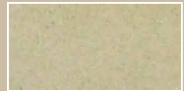
CODICE PFVIVAARENSCUS5 COLORE ARENARIA SCURO