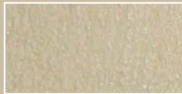
CODICE PFVIVASABSCURS7 COLORE SABBIA SCURO