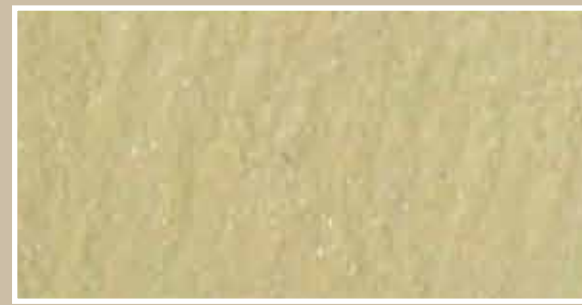
CODICE PFVIVAGLSCURS10 COLORE GIALLO SCURO