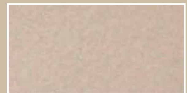
CODICE PFVIVATESMORO2 COLORE TESTA DI MORO

GAMMA COLORI DISPONIBILI SUBITO DA MAGAZZINO