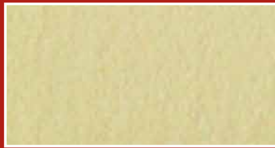
CODICE PFVIVAGLCHI0 COLORE GIALLO CHIARO