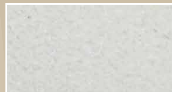
CODICE PFVIVABIANCO1 COLORE BIANCO