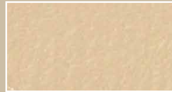
CODICE PFVIVARAMECHI11 COLORE RAME CHIARO