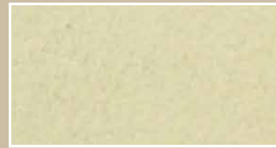
CODICE PFVIVABRONCH3 COLORE BRONZO CHIARO