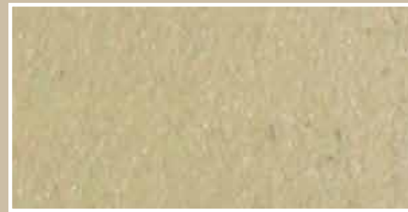
CODICE PFVIVAOCRSCURS4 COLORE OCRA SCURO