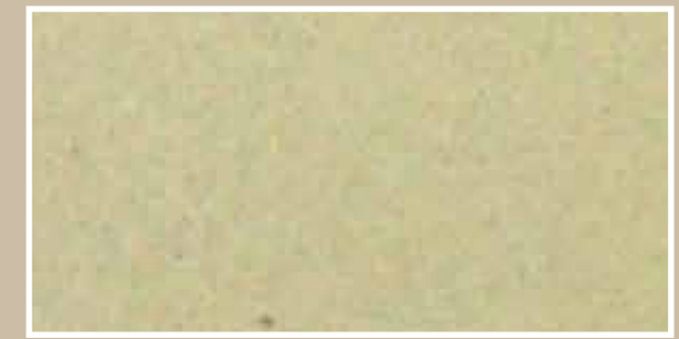
CODICE PFVIVABRONSCUS3 COLORE BRONZO SCURO