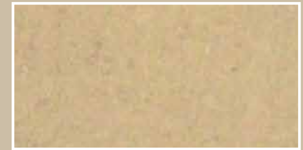
CODICE PFVIVARAMSCUS11 COLORE RAME SCURO