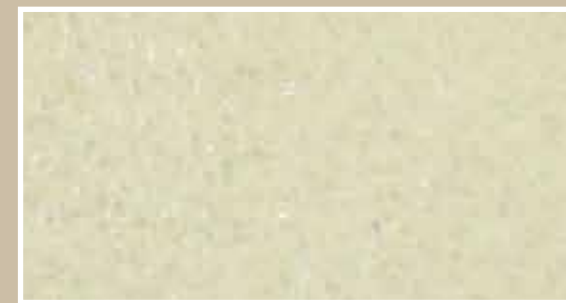
CODICE PFVIVAARENACH5 COLORE ARENARIA CHIARO