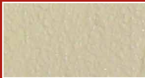
CODICE PFVIVASABBCH7 COLORE SABBIA CHIARO